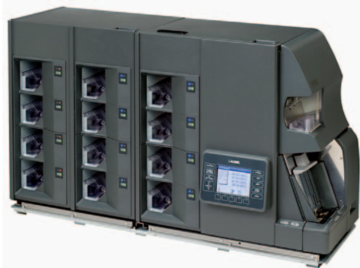
Nell'immagine: La nuova selezionatrice LAUREL a 12 cassette: la punta avanzata di una gamma di macchine assolutamente affidabili e veloci